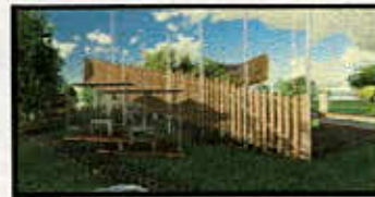
ISLAS DE LECTURA