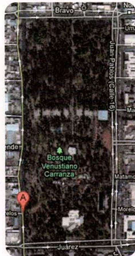
BOSQUE VENUSTIANO CARRANZA