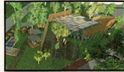
CUBIERTA Y ENVOLVENTE