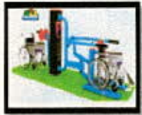
ÁREAS DE EJERCICIO