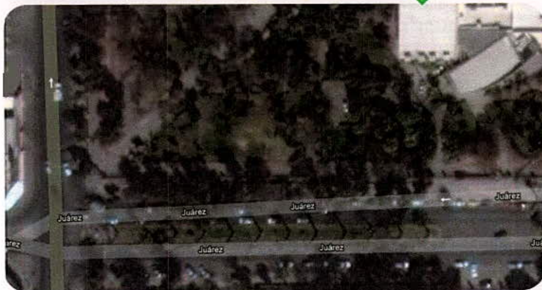
LOCALIZACIÓN DEL PROYECTO